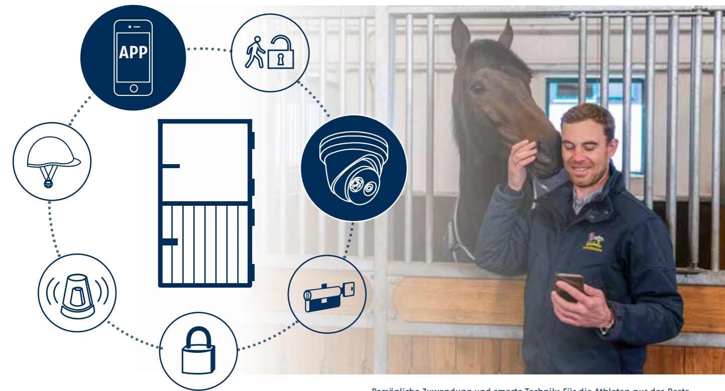
Persönliche Zuwendung und smarte Technik: Für die Athleten nur das Beste.